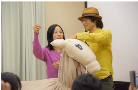
【お馬さんの制作過程を教えて下さる先生ご夫妻】