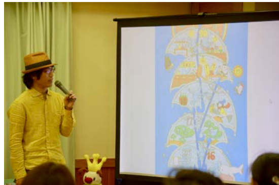
【絵本をご紹介下さるいわい先生】