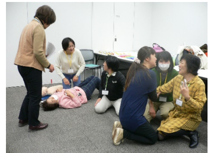
講座 7 でのワーク

今後 2 月に 2 講座、3 月には安全講習会があります。ご参加をお待ちしています。