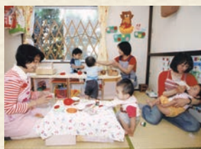
友達や保育者と遊んだり、おもちゃで遊んだり、一人ひとりが好きな遊びをします。