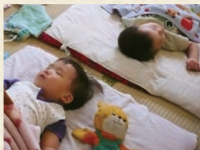
子どもたちが寝ている間も定期的に呼吸確認(SIDSへの対応や窒息防止)を行います。*SIDS:乳幼児突然死症候群