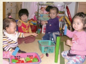
お迎えまでもうひと遊び。