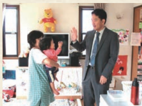
毎朝、子どもの健康状態と昨日からの様子を確認します。