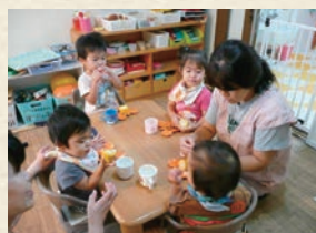
補食として、必要なエネルギーと栄養素を組合せたおやつを提供します。