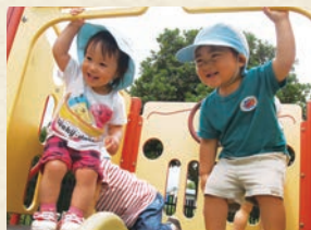
毎日散歩をしたり、庭、公園などで外遊びをします。