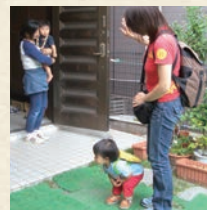
連絡帳を渡して、1日の子ども様子を伝えます。