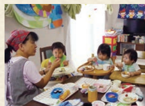
みんなで一緒に食べると食事が楽しくなります。